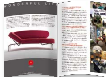
メイン会場や特別企画の決定内容を掲載します。

●出展いただいた企業、団体さまには、出展料金に応じてページをご提供いたします。10万円(税別)で1ページとなります。ページは会期中のイベント情報や広告ページとしてご活用いただけます。掲載内容は基本的に完全データでご提供いただくのを原則とします。相応しくない内容のものはお断りする場合もあります。前付けなどページの指定はできません。ページの並びは申し込み順とさせていただきます。掲載ページの制作をご希望の場合は申込時にお伝えください。別途制作費が必要です。