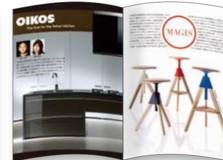
参加企業様の掲載ページ例。