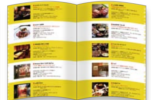
提携レストランの情報ページ。1ページに5店、6ページ30店と提携する予定です。